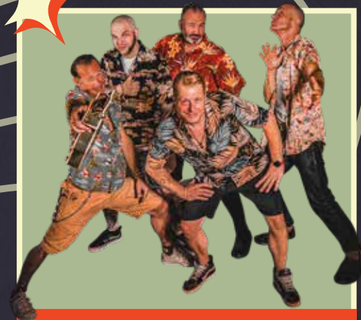
BOPPIN' B (GER)

Boppin' B zünden ab dem ersten Ton ein Rock'n'Roll-Feuerwerk, das bei anderen Bands als Zugabe durchginge. Seit 40 Jahren und 17 veröffentlichten Alben bringen sie mit ihrem energiegeladenen Mix aus Rockabilly, Swing und purem 50s-Spirit jede Bühne zum Beben. Rasante Rhythmen, wilde Spielfreude und ungebremste Leidenschaft – diese Kultband liefert den Soundtrack für eine unvergessliche, tanzgetriebene Nacht. Let's rock that swing!